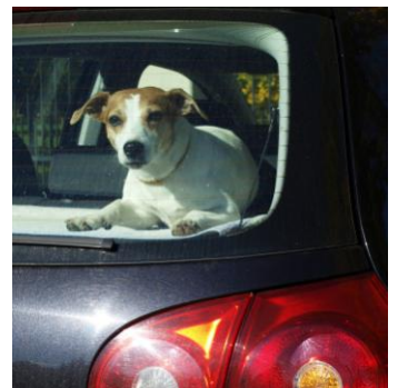
Dit is levensgevaarlijk!

Als uw huisdier niet gewend is om met de auto te reizen, is het verstandig van tevoren enkele korte ritjes te maken. Zorg onderweg voor een veilige plaats in de auto. Honden kunnen in een reiskennel reizen, maar er zijn ook speciale hondengordels. Deze hondengordels of reiskennels zijn in sommige landen, waaronder Duitsland, verplicht! Laat de hond er van tevoren aan wennen. Zet de hond niet voorin op de bijrijdersplaats, zeker als daar een airbag zit, en laat hem nooit reizen op de hoedenplank. Een kat kunt u het beste in de reiskooi houden. De kat voelt zich dan veiliger en het voorkomt ongelukken. Het los meenemen van dieren is gevaarlijk. Denk bijvoorbeeld aan de gevolgen van een botsing, het ontsnappen van uw huisdier of een dier dat onder de pedalen kruipt!